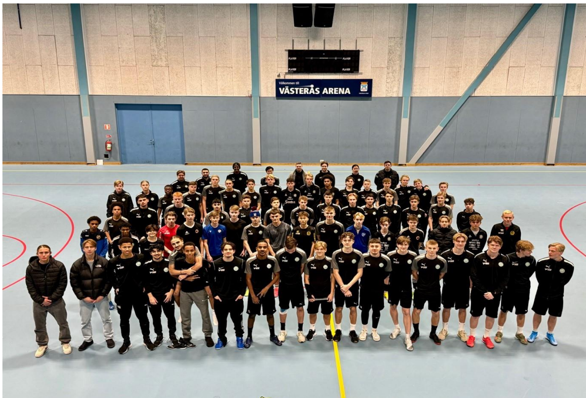
Foto: En samlad akademi inför Futsalturnering i samband med avslutningen år 2023.