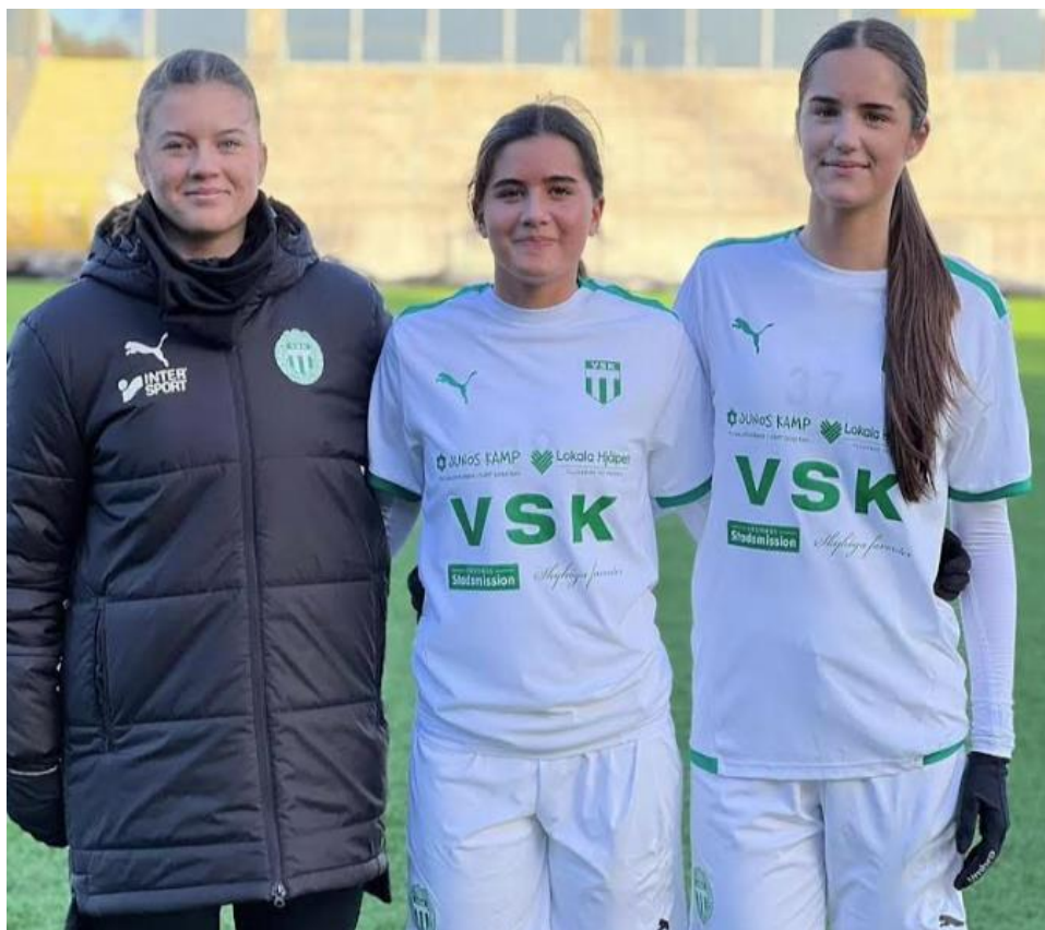
Foto: F17-tjejer hjälper damlaget

Samarbetet med damlaget har länge varit utbrett. Till 2023 lyftes ett par talanger upp till seniorlaget. Här har VSK en mycket gynnsam sats kommande år med många unga talanger som knackar på dörren till spel i damlaget.