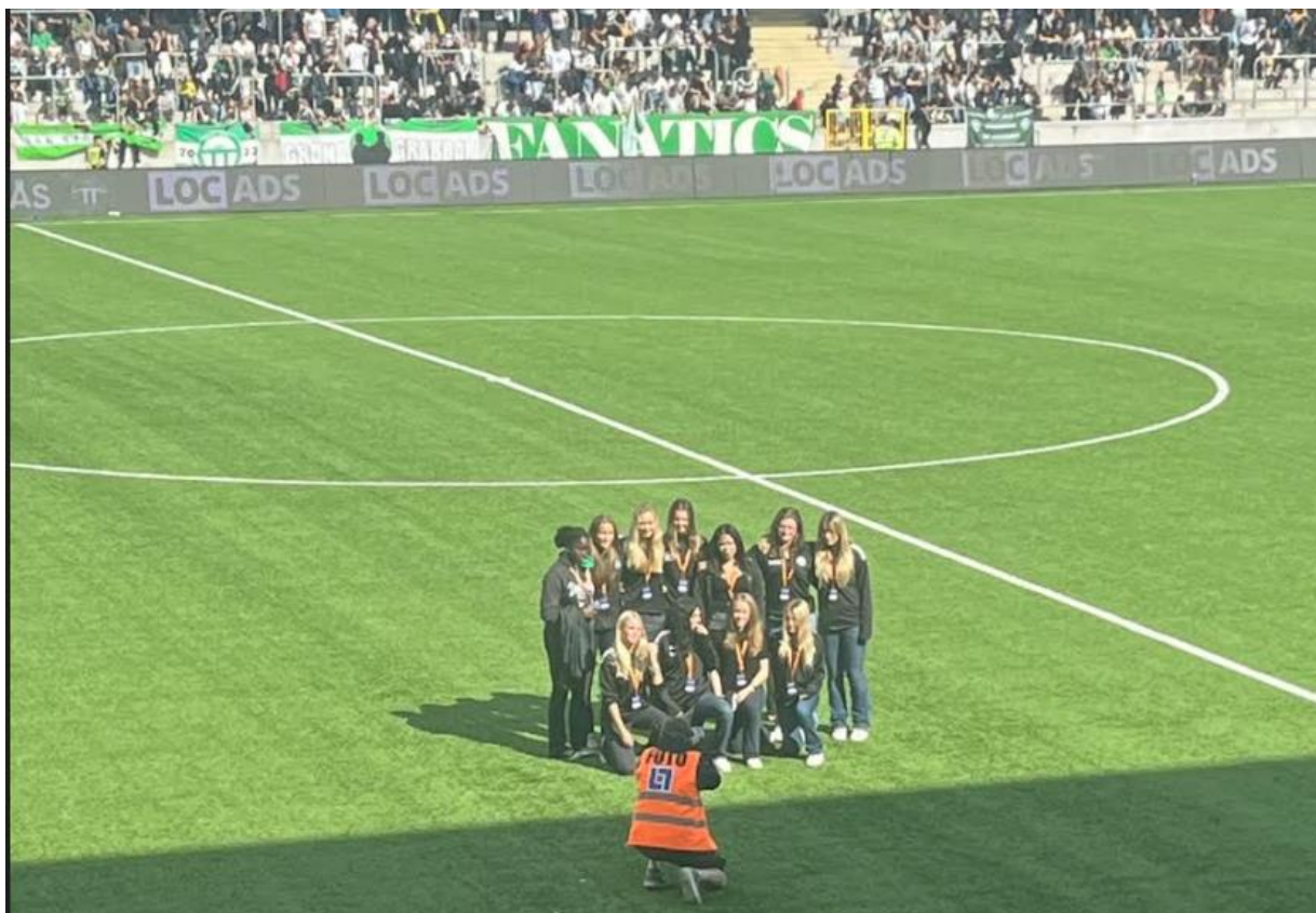
Foto: F17, uppmärksammas under VSK-Gefle 30 juli

Sommaren bjöd på Gothia Cup i F16 där våra grönvita tjejer nådde hela vägen till semifinal och kunde stoltsera med att vara bästa nordiska lag i klassen.