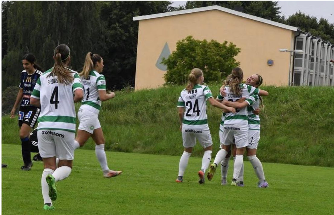
Firande efter vinst i återstarten av hösten.

Inledningen av seriespelet var lite trevande men lagom till försommaren hade VSK fått upp farten och Västerås kunde se fram emot en seriefinal 25 juni mot lokalkonkurrenten Gideonsberg. Nära 500 personer hade tagit sig till Hitachi Energy Arena där de fick njuta av sommarvärme och en spännande match. Trots spelövertag förlorade VSK och gick till sommarvila som tvåa i serien.