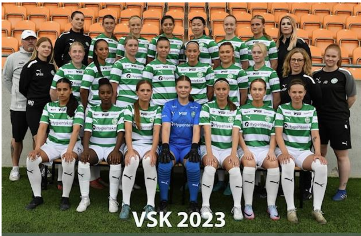
VSK dam, säsongen 2023.

Med en mindre och förnygrad trupp gick damerna in i säsongen 2023 med ett tydligt mål, att vinna div 2.