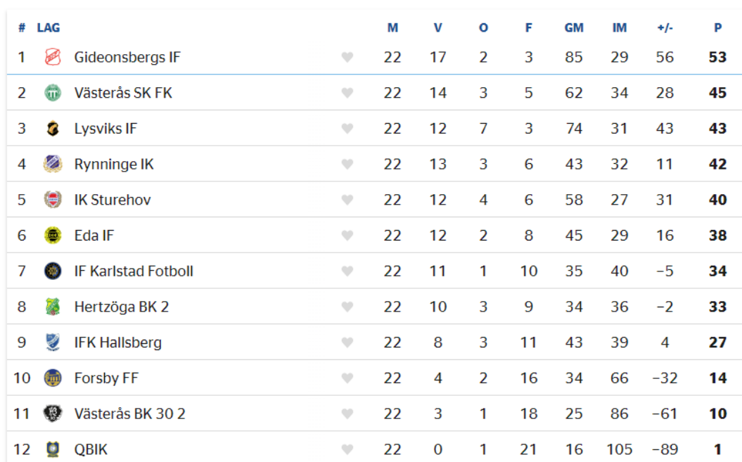
Tabell: Sluttabell division två dam Västra Svealand säsongen 2023.